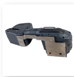
■ 悬挂架 用于悬挂机器在固定位置使用