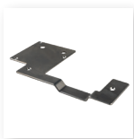
■ 保护底板 用于粗糙表面的捆包物