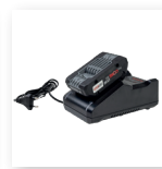
■ 电池充电器 用于安全且稳定的充电